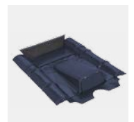
KDF Typ Beton