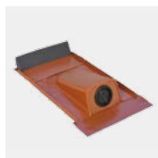
RDF Typ Ton mit Tülle