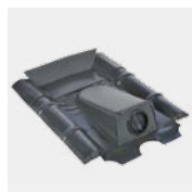
RDF Typ Beton mit Tülle