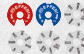
Markierung für Kalt- und Warmwasser