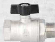
AG X IG mit Flügelgriff