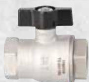
IG X IG mit Flügelgriff