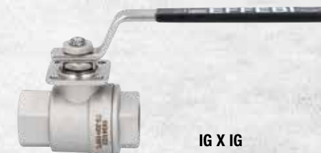
IG X IG mit Edelstahlhebel