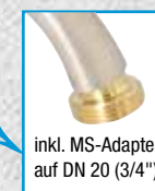
inkl. MS-Adapter auf DN 20 (3/4")