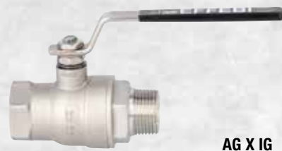
AG X IG mit Stahl-Hebel