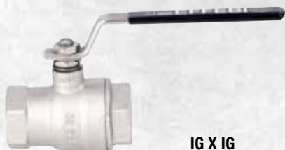
IG X IG mit Stahl-Hebel