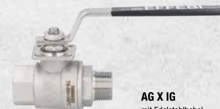
AG X IG mit Edelstahlhebel