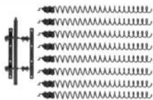
23 Reinigungsmechanismus • Passend für Eventura HVL 2.0 • Leistung: 25 und 30 kW