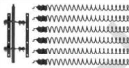
22 Reinigungsmechanismus • Passend für Eventura HVL 2.0 • Leistung: 20 kW