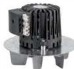
28 Rauchgasgebläsemotor • Passend für Eventura HVL 2.0 und HV • Mit Lüfterrad