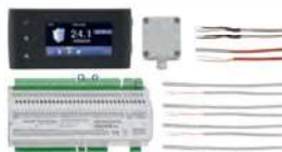
36 Komplettsset Igneo Touch I und HVL • Mit Sensoren und Big Modul