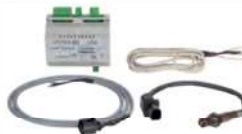
30 Lambdasonde • Passend für Eventura • Mit Modul HVL 2.0 PKL und PKKL