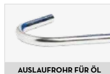
AUSLAUFROHR FÜR ÖL