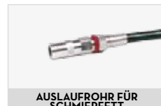
AUSLAUFROHR FÜR SCHMIERFETT