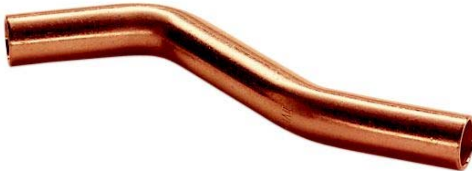
XPCU 087, Übersprungbogen A/A