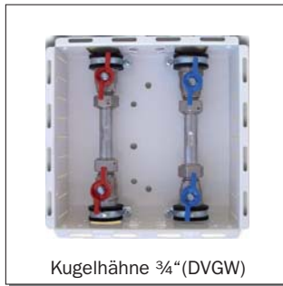
Kugelhähne 3/4" (DVGW)