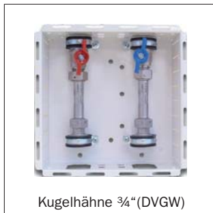
Kugelhähne 3/4" (DVGW)