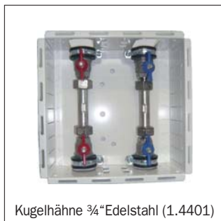
Kugelhähne 3/4"Edelstahl (1.4401)