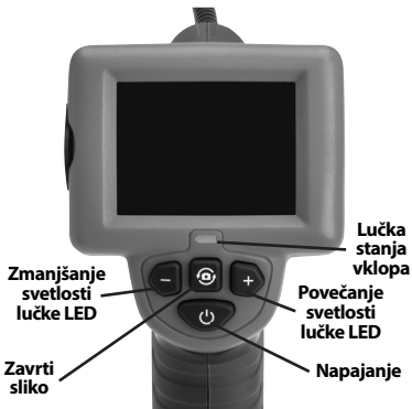
Slika 7 - Krmilni elementi