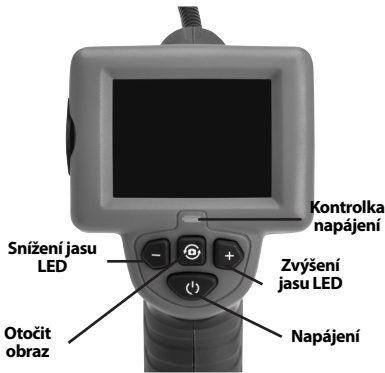
Obrázek 7 – Ovládací prvky