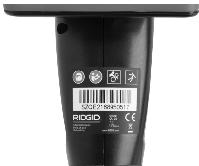
Figuur 6 – Waarschuwingsplaatje