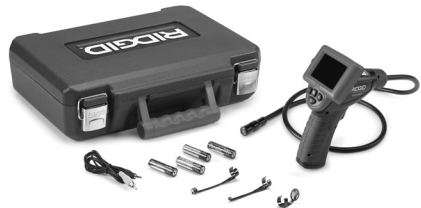
Şekil 1 – micro CA-25