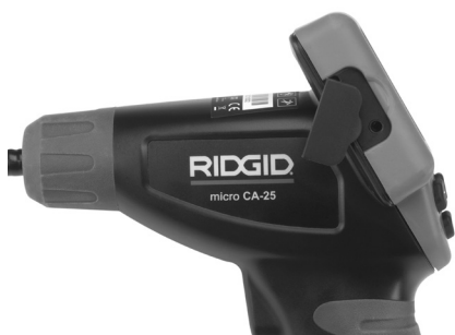
Figura 8 – Tomada de TV

Insira a outra extremidade na tomada de Entrada de Vídeo na televisão ou monitor. A televisão ou o monitor podem ter de ser configurados para a entrada correcta para permitir a visualização.