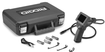
Obrázek 1 - micro CA-25