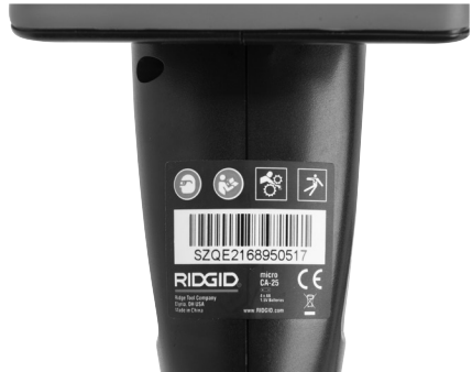
Kuva 6 - Varoitusarra