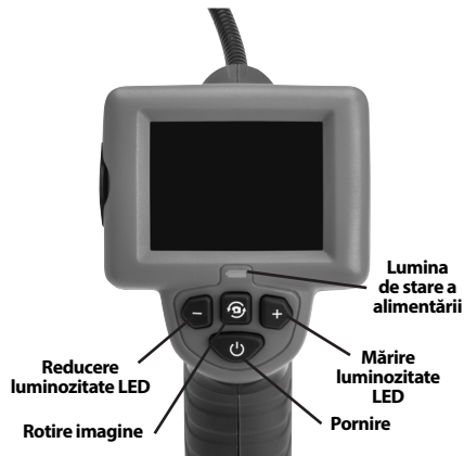
Figura 2 – Comenzi