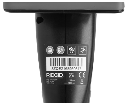
Slika 6 - Naljepnica s upozorenjem