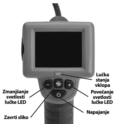
Slika 2 – Elementi za upravljanje