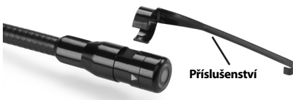
Obrázek 5 – Instalace příslušenství

Při připojování uchopte zobrazovací hlavici způsobem uvedeným na Obrázku 5. Přetáhněte polokruhový konec příslušenství přes plošky na zobrazovací hlavici způsobem uvedeným na Obrázku 5. Potom otočte příslušenství o 1/4 otáčky tak, aby dlouhé raménko příslušenství vyčnívalo ven dle obrázku.