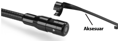
Şekil 5 – Aksesuarların Yerleştirilmesi

Bağlamak için, kamera kafasını Şekil 5 üzerinde gösterildiği gibi tutun. Aksesuarın yarım daire ucunu, Şekil 5'te gösterilen şekilde kamera kafasının içerisine kaydırın. Daha sonra aksesuarın uzun kolu gösterildiği gibi uzanacağı şekilde aksesuarı 1/4 tur döndürün.