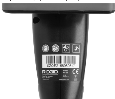
Figura 6 – Eticheta de avertizare