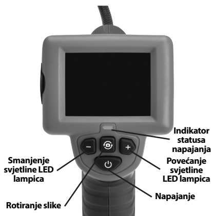
Slika 2 - Komande