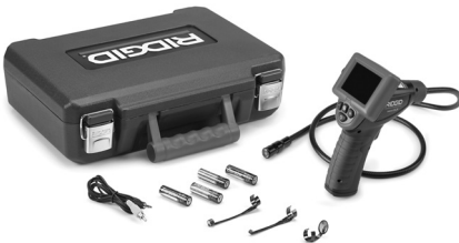
Abbildung 1 - micro CA-25