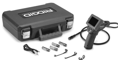
Рис. 1 - Инспекционная видеокамера micro CA-25