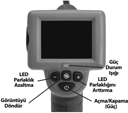
Şekil 7 – Kumandalar