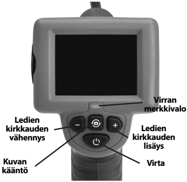
Kuva 7 - Säätimet