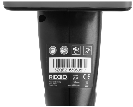
Şekil 6 – Uyarı Etiketi