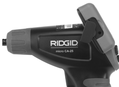
Εικόνα 8 – TV-OUT Jack

Εισαγάγετε το άλλο άκρο στην υποδοχή jack Video In της τηλεόρασης ή του μόνιτορ. Ενδέχεται να χρειαστεί να ρυθμίσετε την τηλεόραση ή το μόνιτορ στο κατάλληλο σήμα εισόδου, ώστε να είναι εφικτή η παρατήρηση.