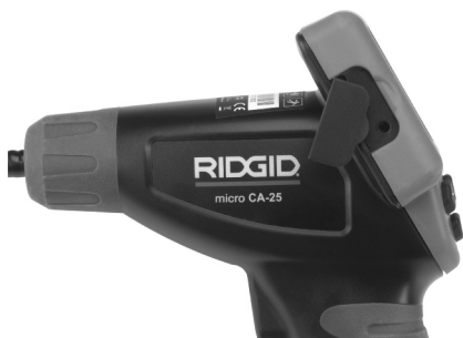
Figura 8 – Enchufe hembra TV-OUT

Introduzca el otro extremo del cable en la entrada hembra Video In en el televisor o monitor. Es posible que el televisor o monitor requieran ser regulados a la posición correcta para mostrar las imágenes siendo transmitidas.