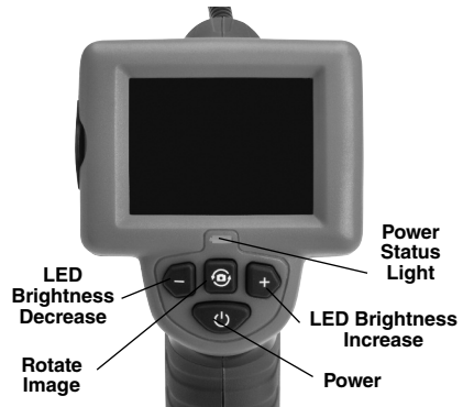
Figure 7 – Controls