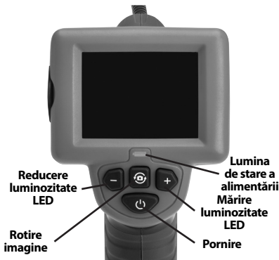
Figura 7 – Butoane de control