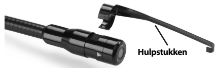
Figuur 5 – Installeren van toebehoren

vervolgens een kwartslag, zodat de lange arm uitsteekt zoals afgebeeld.