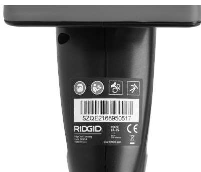
6. ábra - Figyelmeztető címke