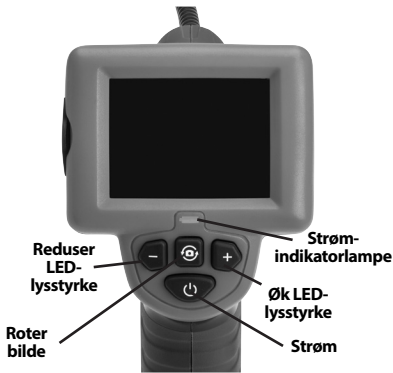
Figur 7 – Kontroller