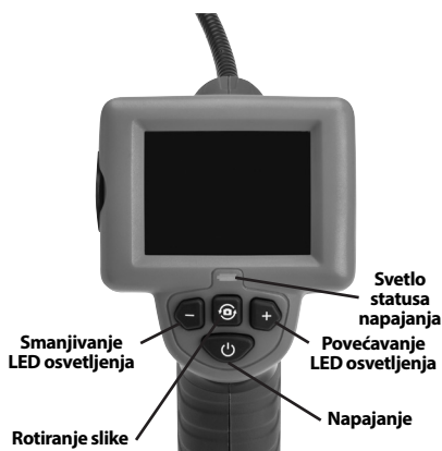
Slika 2 - Upravljački elementi