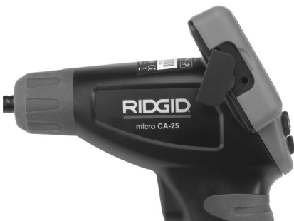
Figure 8 – TV-OUT Jack

Insert the other end into the Video In jack on the television or monitor. The television or monitor may need to be set to the proper input to allow viewing.