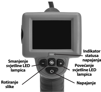
Slika 7 – Komande