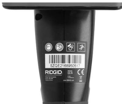
Slika 6 - Upozoravajuća nalepnica