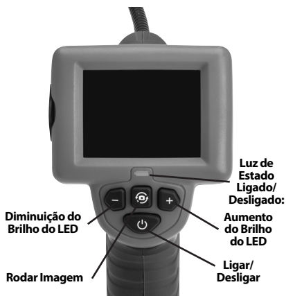
Figura 2 - Controlos