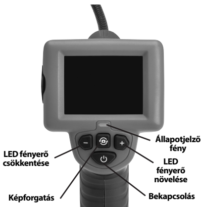
2. ábra – Vezérlők