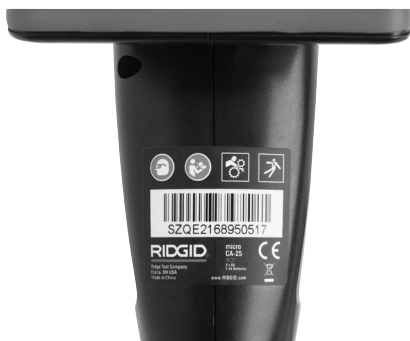
Figura 6 – Etichetta di avvertimento