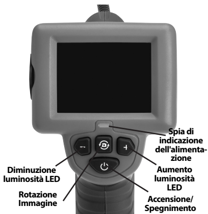
Figura 2 – Comandi