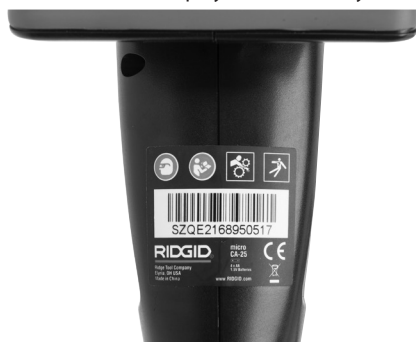
Ryunek 6 – Etykieta ostrzegawcza