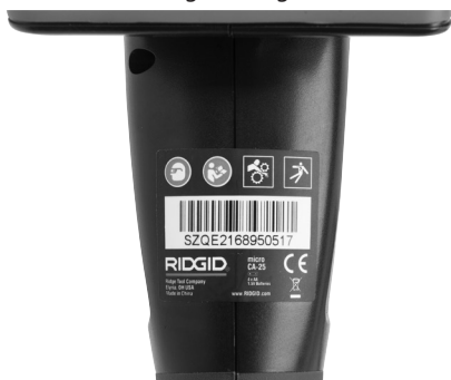
Figura 6 – Rótulo de aviso