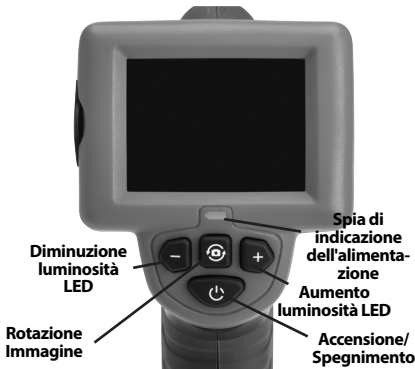
Figura 7 – Comandi