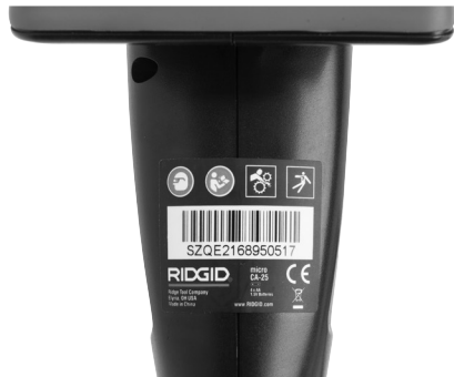
Figur 6 – Advarselsmerking