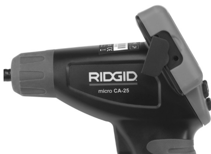
Slika 8 - TV-OUT utikač

Drugi kraj kabla umetnite u Video In priključak na televizoru ili monitoru. Televizor ili monitor možda treba podesiti na odgovarajući ulaz da bi se omogućilo gledanje.