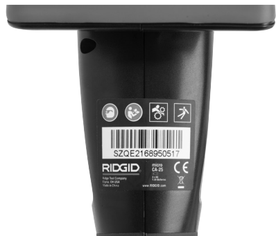
Obrázek 6 – Výstražný štítek