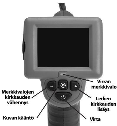
Kuva 2 – Säätimet