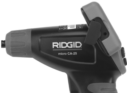
Рис. 8 – Разъем TV-OUT

Вставьте другой конец кабеля в гнездо видеовхода телевизора или видеомонитора. Возможно, для просмотра изображения на телевизоре или видеомониторе придется включить соответствующий вход видеосигнала.