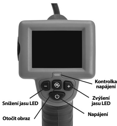
Obrázek 2 – Ovládací prvky