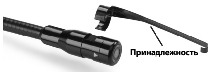
Рис. 5 - Установка аксессуаров

Чтобы прикрепить приспособление, необходимо удерживать головку формирования изображения так, как показано на рис. 5. Вставьте полукруглый конец приспособления на лыску головки формирования изображения, как показано на рис. 5. Затем поверните приспособление на 1/4 оборота так, чтобы его длинная ручка выдвигалась наружу, как показано на рисунке.