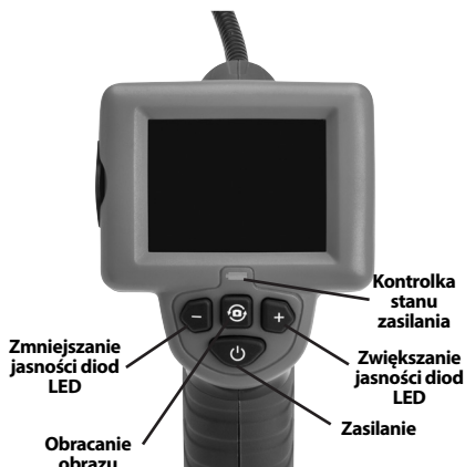
Rysunek 2 - Elementy sterujące