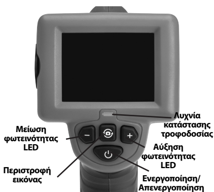
Εικόνα 7 – Χειριστήρια