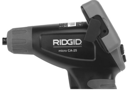
Şekil 8 – TV-ÇIKIŞ Jaki

Diğer ucunu, televizyon veya monitör üzerindeki Video Giriş yakına takın. Televizyon veya monitörün, görüntü alımını sağlamak için doğru giriş ayarlanması gerekebilir.