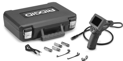
Slika 1 – Kamera micro CA-25