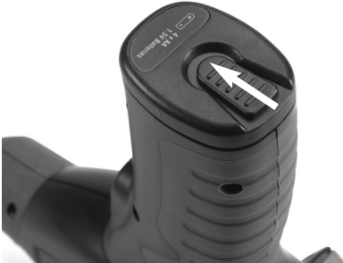
Figura 3 – Tapa del compartimiento de las pilas

CA-25 (ver Figura 4). Retire las pilas usadas de su caja, si es necesario reemplazarlas.