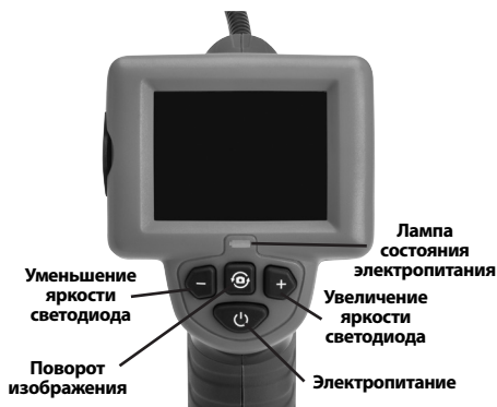
Рис. 7 - Средства управления