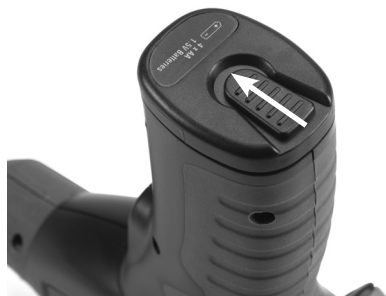
Slika 3 – Poklopac pretinca za baterije