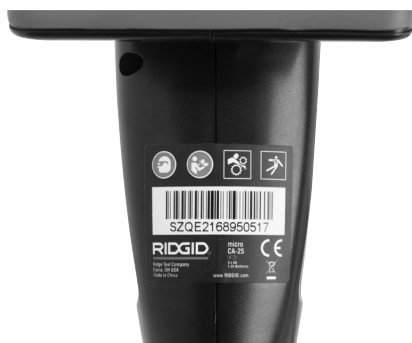
Obrazok č. 6 - Výstražný štítok