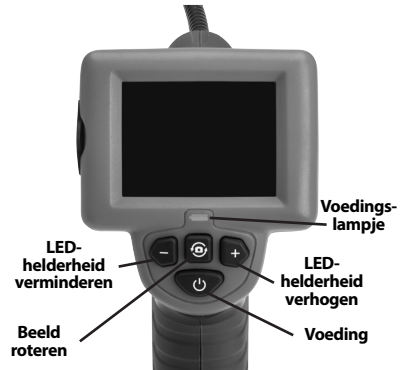
Figuur 7 – Bedieningselementen