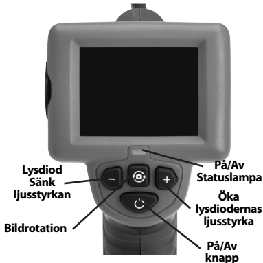
Figur 7 – Reglage