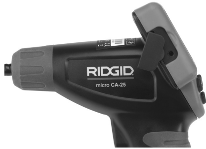
Kuva 8 - TV-OUT-liitäntä

Työnnä kaapelin toinen pää television tai monitorin Video In -liittimeen. Televisiosta tai näyttölaitteesta voidaan joutua valitsemaan oikea tulo, jotta laitteen kuvaa voidaan katsella.