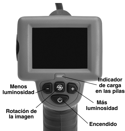
Figura 2 – Mandos