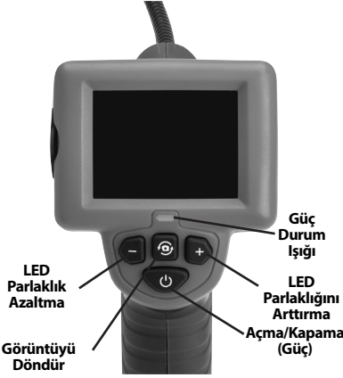
Şekil 2 - Kumandalar