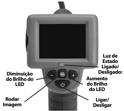
Figura 7 – Controlos