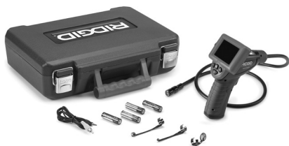
Εικόνα 1 – micro CA-25