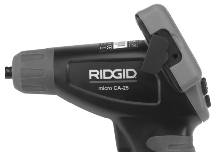
Obrázek 8 – konektor „TV-OUT“

Druhý konec zasuňte do zdířky vstupu video-signálu na televizi či monitoru. Televizi nebo monitor bude možná nutné nastavit pro zobrazování příslušného vstupu videa.