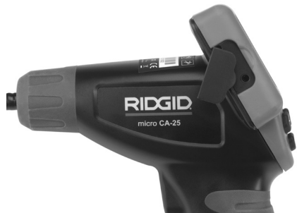
Figur 8 – TV OUT-jack

Anslut den andra änden till uttaget Video In på tv-mottagaren eller bildskärmen. TV-mottagaren eller bildskärmen kan behöva ställas in på rätt ingång för att tillåta visning.