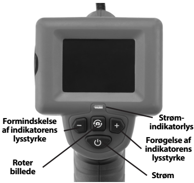
Figur 7 – Kontroltaster