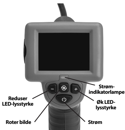
Figur 2 – Kontroller