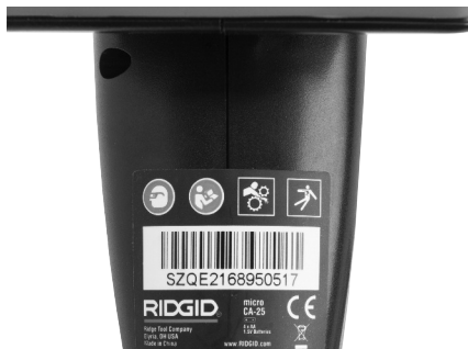
Figura 6 – Etiqueta de advertencias