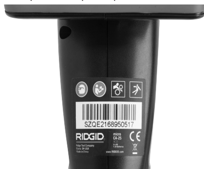
Εικόνα 6 – Ετικέτα προειδοποίησης