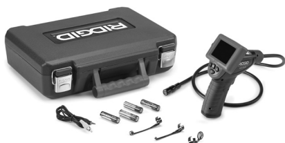
Rysunek 1 - micro CA-25