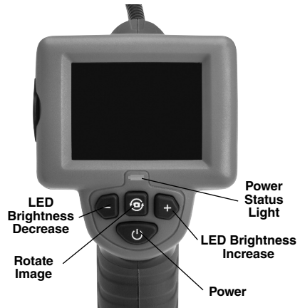
Figure 2 – Controls