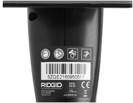
Figure 6 – Warning Label