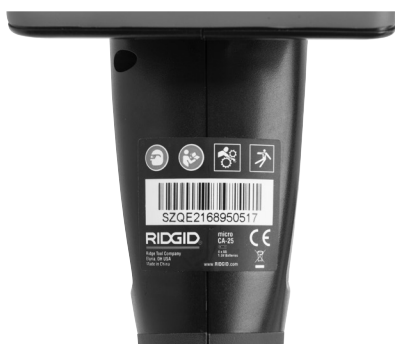
Рис. 6 - Предупредительная этикетка