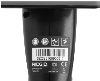
Abbildung 6 – Warnschild