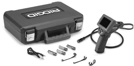
Figure 1 – micro CA-25