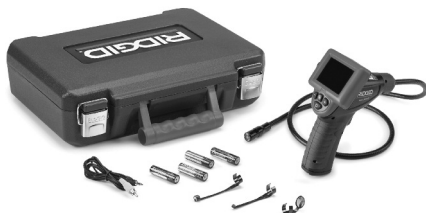
Figure 1 – Caméra d'inspection micro CA-25