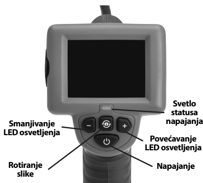
Slika 7 - Upravljački elementi