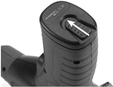
Figuur 3 – Klepje v.h. batterijcompartiment