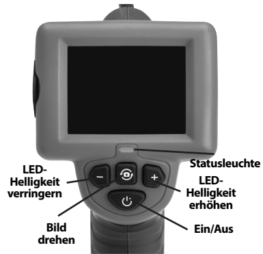
Abbildung 7 – Bedienelemente