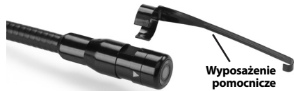
Rysunek 5 – Montowanie akcesoriów

W celu zamontowania należy przytrzymać głowicę kamery, jak pokazano na Rys. 5 Ustawić półokrągłą końcówkę z obejmą nad płaską częścią głowicy kamery jak pokazano na Rys. 5. Następnie obróć o 1/4 obrotu, aż ramię akcesorium zostanie dopasowane we wskazany sposób.