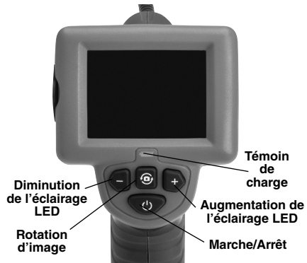
Figure 7 – Commandes