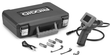
Figur 1 – micro CA-25