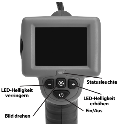
Abbildung 2 – Bedienelemente der Display-Einheit