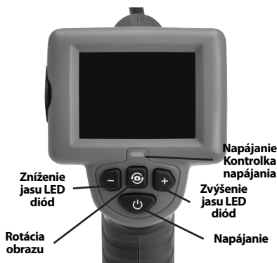
Obrázok č. 7 - Ovládacie prvky