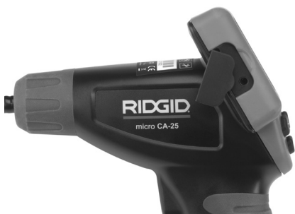
Figuur 8 – TV-out uitgang

Steek het andere uiteinde in de Video In-bus van de televisie of monitor. De televisie of monitor moet mogelijk worden ingesteld op het correcteingangssignaal om een beeld te krijgen.