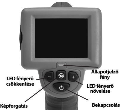
7. ábra - Vezérlők