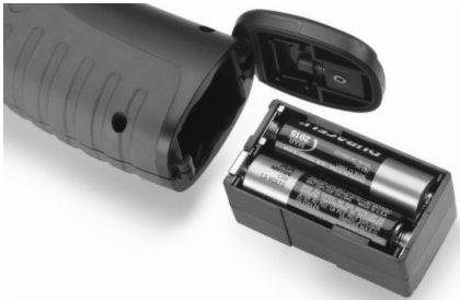
Figura 4 – Caja y compartimiento de las pilas