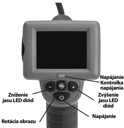
Obrázok č. 2 - Ovládacie prvky