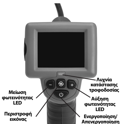
Εικόνα 2 – Κουμπιά ελέγχου