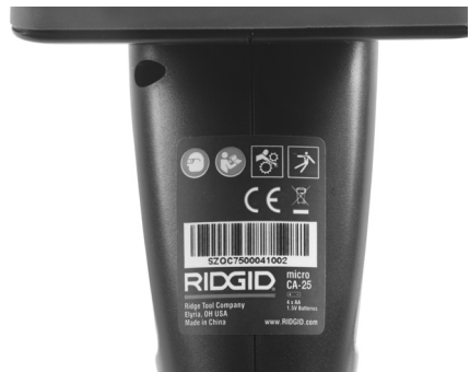
Figur 6 – Advarselmærkat