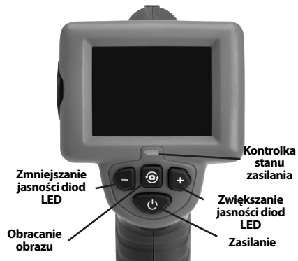
Rysunek 7 – Elementy sterujące

i na obszarze roboczym nie ma osób postronnych i innych przeszkód.