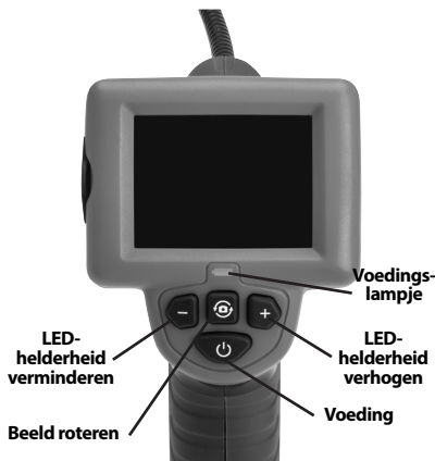
Figuur 2 – Bedieningselementen