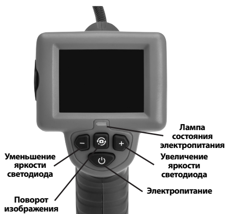
Рис. 2 - Средства управления