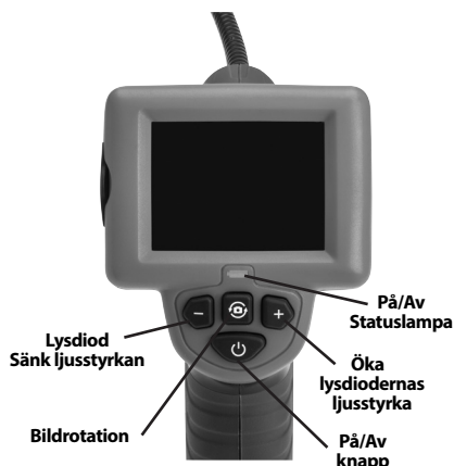
Figur 2 – Reglage