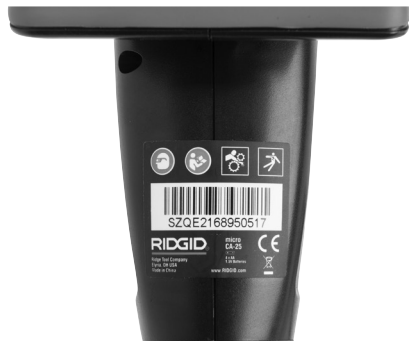
Figur 6 – Varningsdekal