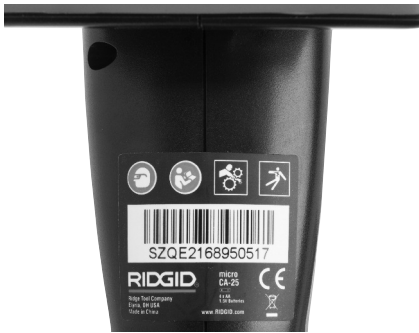
Figure 6 – Etiquette de sécurité