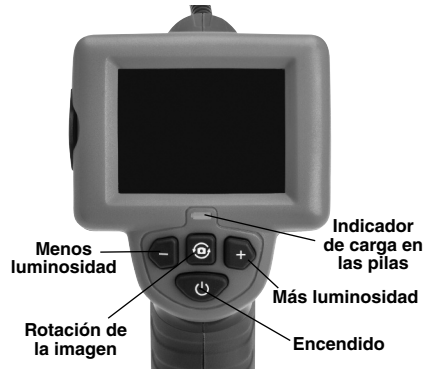
Figura 7 – Mandos