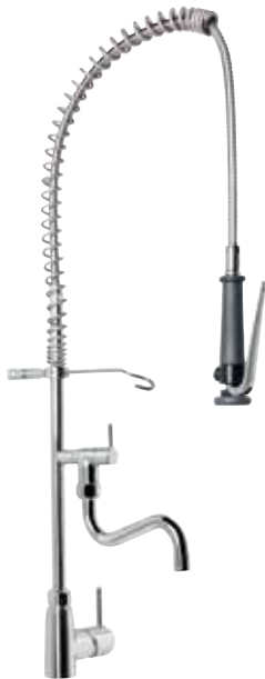
Gastro Profiküche Einhebelmischer