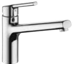
Luna E Standard

Technik | • Eigensicher gegen Rückfließen