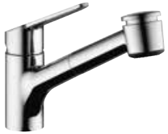
Isla mit herausziehbarer Geschirrbrause