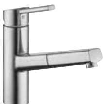
Luna E mit herausziehbarem Auslauf