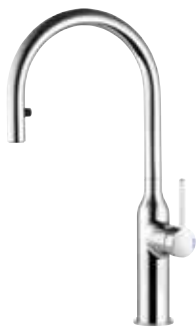
Sin mit herausziehbarem Auslauf