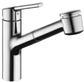
Luna E mit herausziehbarer Geschirrbrause