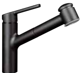
Luna E mit herausziehbarer Geschirrbrause