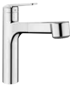
Domo mit herausziehbarer Geschirrbrause