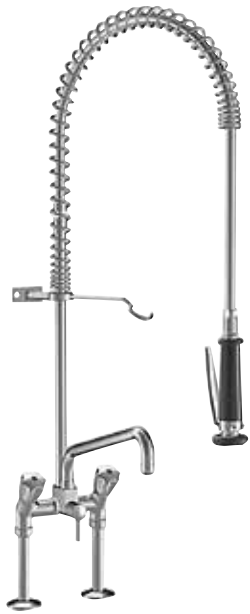
Gastro Profiküche Zweigriffmischer