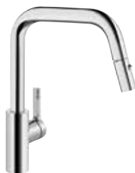
Luna E mit herausziehbarem Auslauf