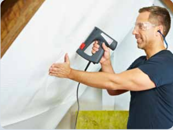
Folie beim Dachbodenausbau einfach befestigen.