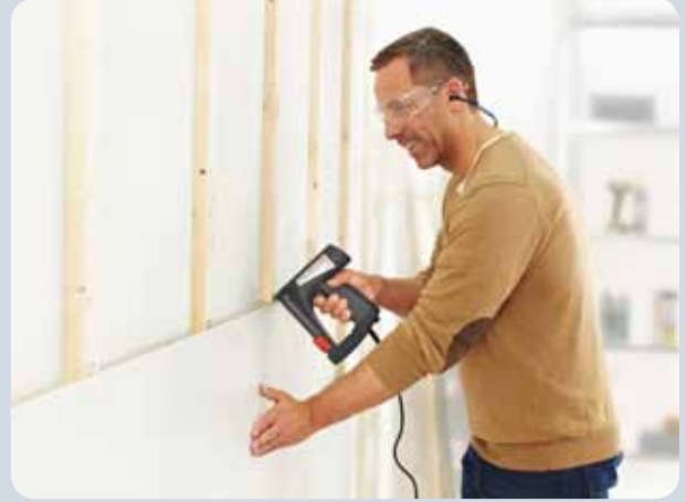
Profilhölzer mit Profilholzkralen befestigen.