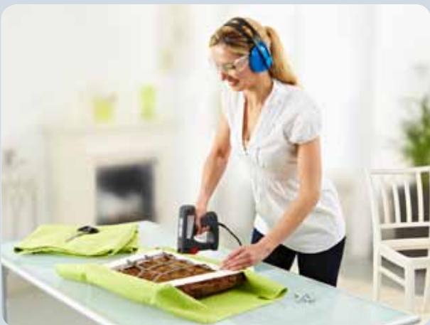
Einfaches Befestigen vom Stoffen beim Polstern.