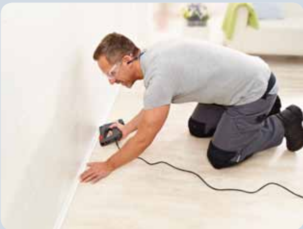
Zierleisten können schnell und einfach getackert werden.