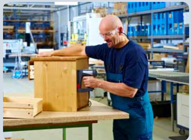
Schnelles Nageln von z.B. Möbelerückwänden mit dem Tacker.