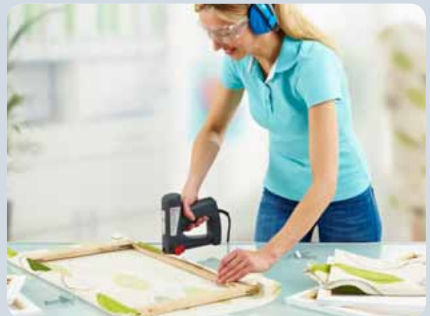
Schnelles Bespannen von Bilderrahmen.