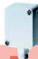
Fühler für Außenmontage Sensor for outdoor mounting